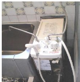
屋内式ガス風呂ガマ

『長期使用製品安全点検制度』と『長期使用製品安全表示名称』の二が施行されました。名称の違いは『点検』と『表示』です。